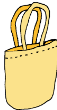
トートバック (イメージ)

初回はA4が入るトートバック 2回目・3回目はつば付き リバーシブル帽子を作ります!